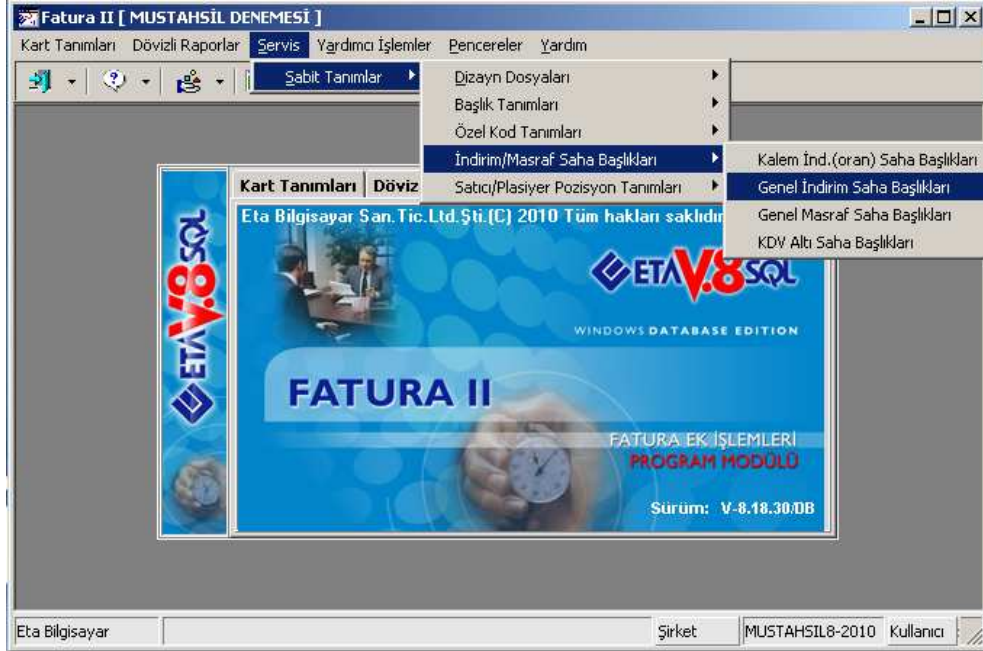
Ekran 3 : Genel İndirim Saha Başlıkları Ekranı

Fatura II modülü Ekran 3'teki Servis / Sabit Tanımlar / İndirim Masraf Saha Başlıkları / Genel İndirim Saha Başlıklarına girilir.