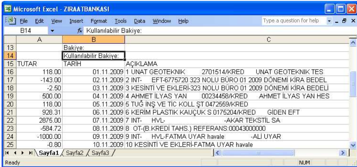
Ekran 1 : Ziraat Bankası Excel Dosyası

Banka hareketleri Ekran 1'de görüldüğü gibi Excel formatındaki bir dosyadan muhasebe fişindeki ilgili sahalara tek bir işlem ile taşınabilir.