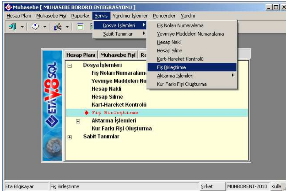
Ekran 1 : Servis/Dosya İşlemleri ekranından Fiş Birleştirme seçimi

Fiş birleştirme için Ekran 1'deki Muhasebe modülü Servis/Dosya İşlemleri/Fiş Birleştirme ekranına girilir.