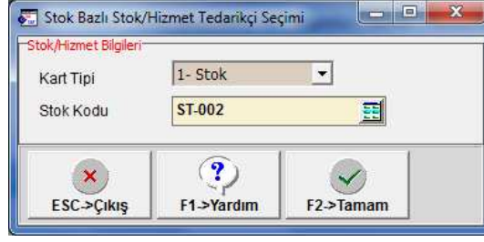
Ekran 4: Stok Bazlı Tedarikçi Seçimi

Stok Bazlı Tedarikçi Belirleme: Stok Bazlı İşlem bölümünde ilk olarak Stok Kodu seçilir.