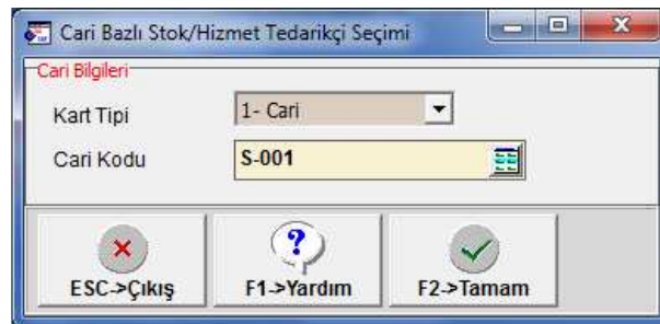
Ekran 6: Cari Bazlı Tedarikçi Seçimi

Cari Bazlı Tedarikçi Belirleme: Cari Bazlı İşlem bölümünde ilk olarak Cari Kodu seçilir.