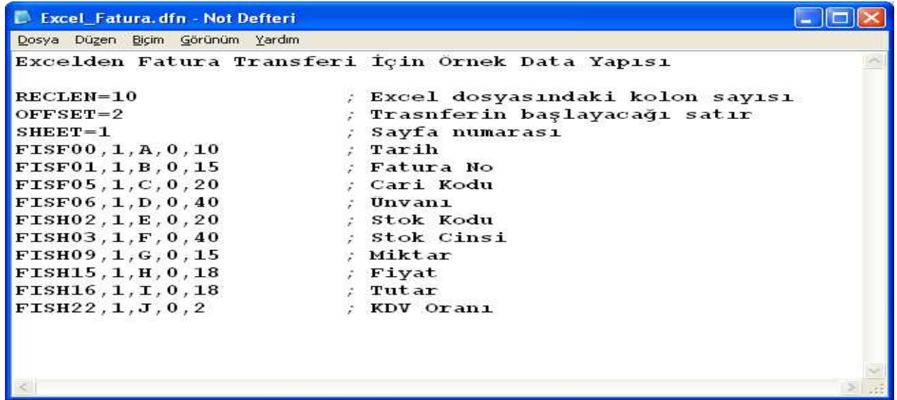
Ekran 2: Excel_Fatura.dfn Dosyasının Yapısı

Örneğimizdeki Excel tablosuna göre uzantısı DFN olan bir dosya hazırlanır. Bu dosya, Excel tablosundaki verilerin ETA tarafından hangi alanlara yerleştirileceği bilgisini içermektedir. Örneğimizde; Excel_Fatura.dfn isimli bir dosya oluşturulmuştur. Bu dosyanın içeriğindeki "FISF00" faturanın tarihini, "FISF01" fatura numarasını simgelemektedir. Bu simgelerin ne olduğu ise EtaSaha.efi dosyasının içerisinde yer almaktadır. (Ekran 3). FISF00 simgesinin yanında yer alan "1" ise saha tipini göstermektedir. (Bu alanların hepsine 1 verilebilir ve sahanın alfanümerik olduğunu gösterir). Hemen yanındaki harf ise aynı alanın Excel'de hangi kolonda yer aldığını gösterir. Onun yanındaki rakam da "10" ilgili sahanın boyunu gösterir.