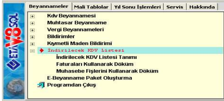
Ekran 1 : İndirilecek KDV Listesi Giriş ekranı

İndirilecek KDV Listesi, hangi modülümüz kullanılarak oluşturulacak ise ilgili modül tanımlamaları, Ekran 1’de görüldüğü gibi Muhasebe IV/Beyannameler/İndirilecek KDV Listesi/İndirilecek KDV Listesi tanımı bölümünden yapılmalıdır.