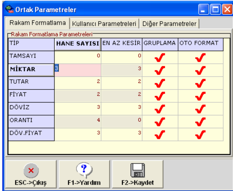
Tablo 1 : “Ortak Parametreler” tablosu

Not : Bu bölümde yapılan tanımlama yeni açılacak tüm şirketlerin Rakam Format Tanımı olacaktır. Tanımlama öncesi açılmış şirketleriniz var ise bu tanımlama bu şirketler için geçerli olmayacaktır. Tanımlama öncesi şirketlerin tanımlaması “Şirket Bazlı Rakam Formatlama Tanımı Nasıl Yapılır ?” başlıklı yardım bölümünde anlatıldığı gibi yapılmaktadır.