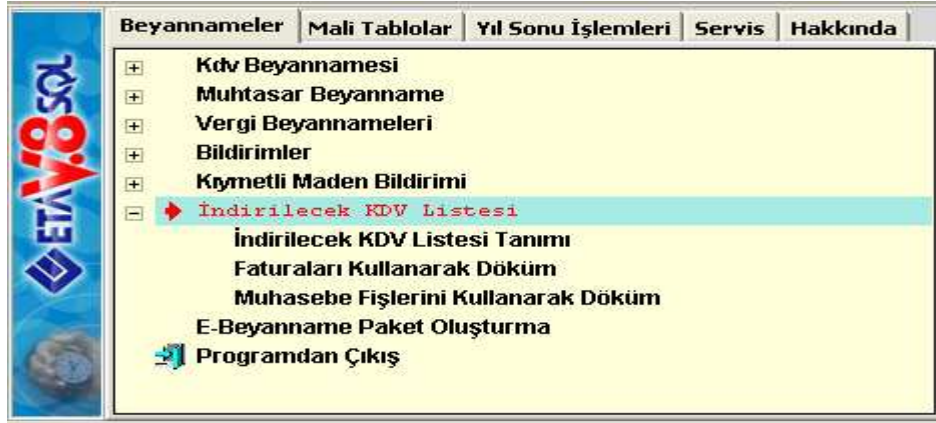
Ekran 1 : İndirilecek KDV Listesi Giriş ekranı

İndirilecek KDV Listesi, hangi modülümüz kullanılarak oluşturulacak ise ilgili modül tanımlamaları, Ekran 1'de görüldüğü gibi Muhasebe IV/Beyannameler/İndirilecek KDV Listesi/İndirilecek KDV Listesi tanımı bölümünden yapılmalıdır.