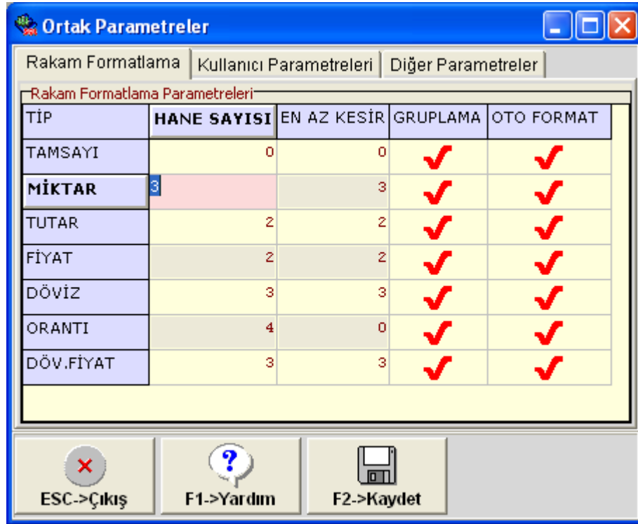
Tablo 1 : “Ortak Parametreler” tablosu

Not : Bu bölümde yapılan tanımlama yeni açılacak tüm şirketlerin Rakam Format Tanımı olacaktır. Tanımlama öncesi açılmış şirketleriniz var ise bu tanımlama bu şirketler için geçerli olmayacaktır. Tanımlama öncesi şirketlerin tanımlaması “Şirket Bazlı Rakam Formatlama Tanımı Nasıl Yapılır ?” başlıklı yardım bölümünde anlatıldığı gibi yapılmaktadır.