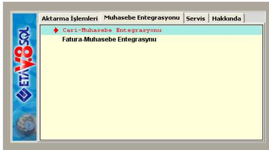
Ekran 1 : Muhasebe Entegrasyonu ekranı

Veri Aktarma modülünde / Muhasebe Entegrasyonu bölümüne girilerek Ekran 1'de görülen Cari-Muhasebe Entegrasyonu veya Fatura-Muhasebe Entegrasyonu'nun seçilmesi gerekmektedir.